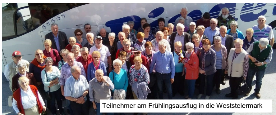
Teilnehmer am Frühlingsausflug in die Weststeiermark

„ Warum auch in die Ferne schweifen, liegt das Gute doch so nah? “; nach diesem Motto wurde zu einem Ausflug auf den Arzberg eingeladen. Überraschend viele Teilnehmer trafen sich beim Gipfelkreuz in 1.111 m Seehöhe zu einer stimmungsvollen Maiandacht und genossen die herrliche Aussicht auf Breitenbrunn und die „Rückseite“ von Mönichwald, laut Überlieferung auch „Kleine Welt“ genannt. Das Heimat-Bewusstsein und viele persönliche Erinnerungen kamen jedenfalls nicht zu